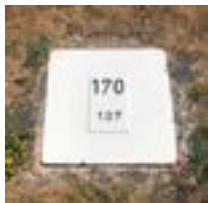
Buhnenstein der Buhne Nr. 170 mit einer Länge von 107 m

Zur Kennzeichnung der Buhnen befindet sich am Ufer ein weißer Buhnenstein.